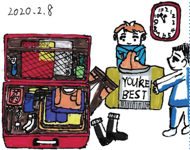
赵禹仲的《爸爸在武汉的日子》