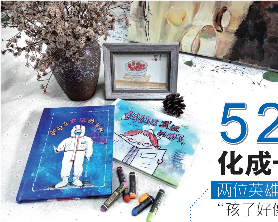
两份成长画册