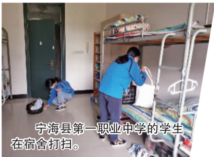
宁海县第一职业中学的学生在宿舍打扫。