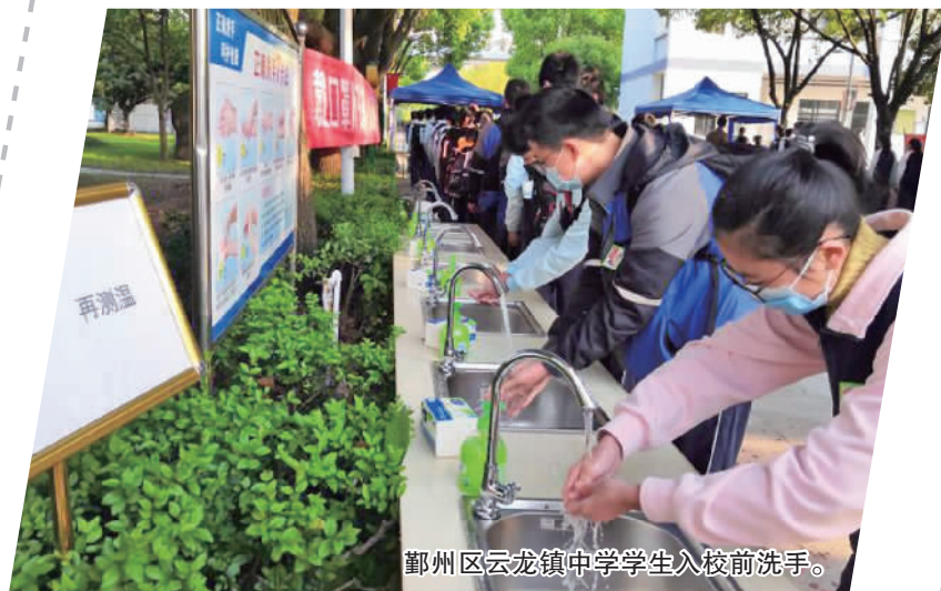
鄞州区云龙镇中学学生入校前洗手。

为此,学校对校门口的水槽进行改造,只用了一天的时间,就将原先一个简易的水龙头改造成了设施齐全的六套水槽。