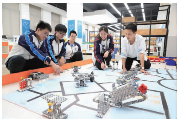
机器人社团的同学们看着自己辛苦研制的智能机器人,很有成就感。

近70年来,这所学校培养了27000余名毕业生。从这里,走出了以中国工程院院士陈剑平、中国科学院院士张明杰为代表的各领域杰出人才。