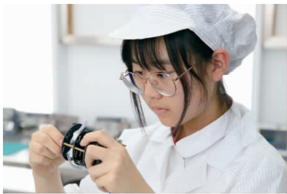
小卫星社团的团员正专注实验