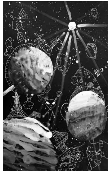
陈欣妤(证号2008461) 指导老师 胡青青 余姚市东风小学教育集团东风校区207班 星球