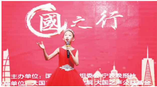
去年,国之行举办经典朗诵选拔活动。