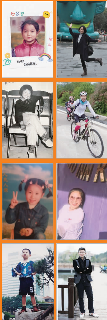
图为本报编辑部成员