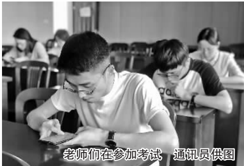
老师们在参加考试