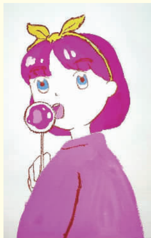
100%甜度女孩 宁波市广济中心小学 302 班 张健琪(证号 2000534) 指导老师 汪银娟