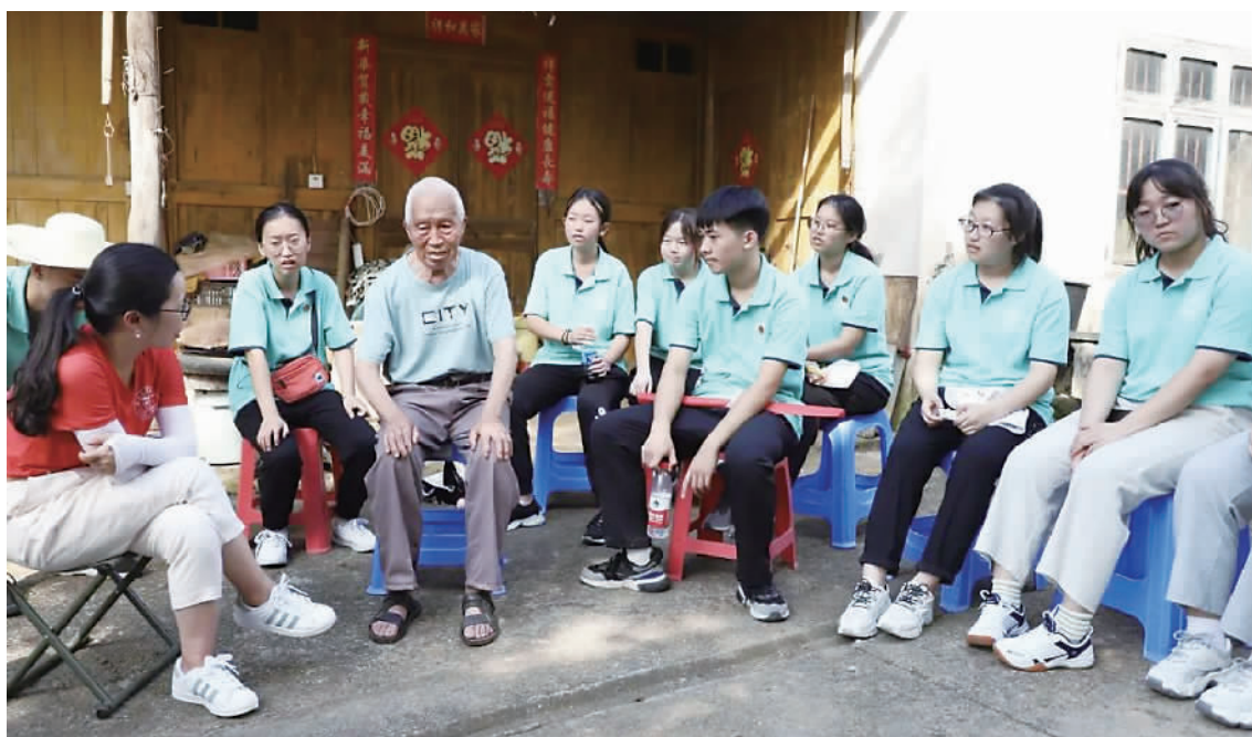
师生听老校友讲当年的求学情况。