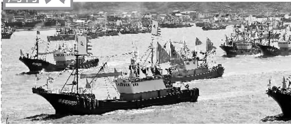
2019年9月16日,渔船奔赴东海。