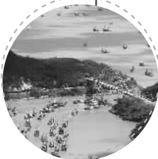
2019年9月16日,大马力钢质渔船奔赴东海。

现在,渔民们谈论最多的话题除了“出海”之外,还有“上岸”。上岸搞旅游、上岸经营冷库,这些跟海打了一辈子交道的长辈们,越来越多地把目光投向了陆地。