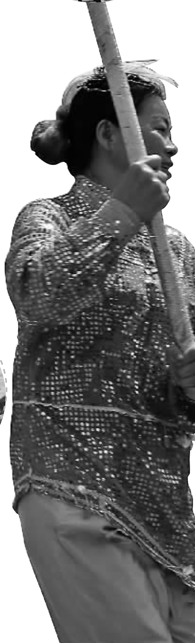
渔民用自己的方式庆祝东海开渔。