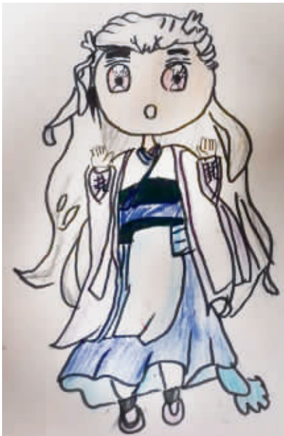
顾琪喆(证号 2008740) 鄞州区董山小学 210 班 指导老师 周璐

有一次，我开玩笑说：“想要一只小鸟。”第二天，她带了一个塑料袋，里面是五彩缤纷的蝴蝶，一共 7 只。她把塑料袋给我，郑重其事地说：“这是给你的，因为我没有抓到小鸟，一个下午只抓到了几只蝴蝶，你能原谅我吗？”我很感动，我真喜欢她呀！