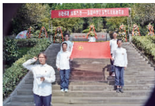
慈湖中学学生在烈士陵园宣誓。