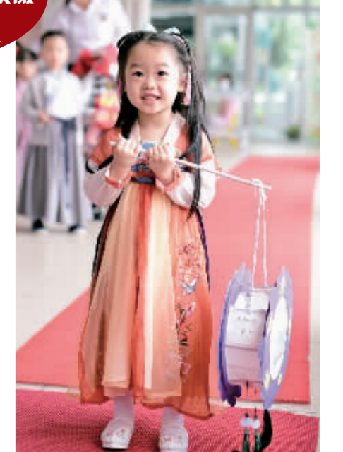
小朋友身着汉服走秀。