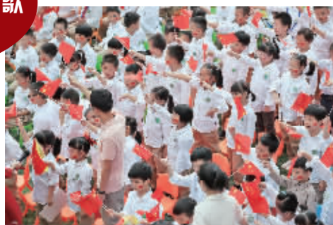
学生一起歌唱红歌。