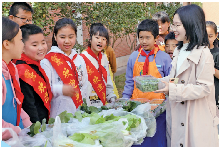
菀湖中心小学的学生进行蔬菜义卖。