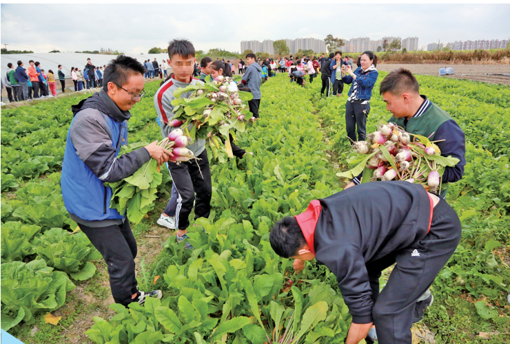
宁波市特殊教育中心学校的学生在拔萝卜。