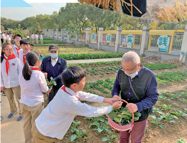
宁波市行知实验小学的学生给社区孤寡老人送上自己种的蔬菜。

顾烽 陆舒雯 朱晖 通讯员 张璐 杨阳 陈静 杜琳 王冬晓 记者 李臻 王伟 钟婷婷 现代金报一甬上教育