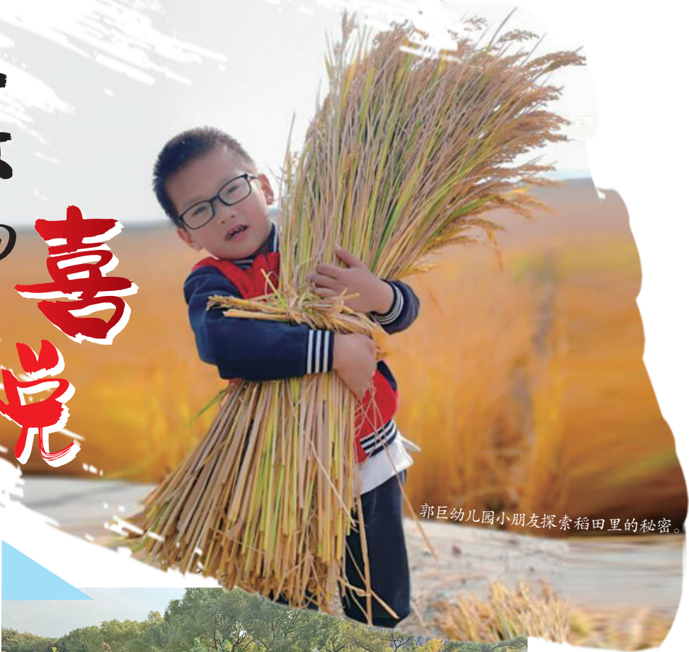
郭巨幼儿园小朋友探索稻田里的秘密。

秋天是丰收的季节。近日,宁波各所学校纷纷开展了劳动课程,把课堂搬进了田间地头,让孩子们零距离体验劳动的艰辛,感受丰收的喜悦。