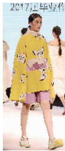
浙纺服院历届“融+”时尚周的精彩瞬间。