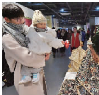
第四届“融+”时尚周上市民带着宝宝来观展。

“通过‘融+’纺服时尚周,我们与企业、行业、政府一道打开了融合共赢的大门,共同开创区域时尚产教融合发展新局面,实现互联网时代的时尚创意与跨界融合,充分展现学校‘国际合作、地方合作’战略优势,向社会呈现开放办学、合作育人、共赢发展的教学成果,凸显产业与教育相融、地方与学校相融、行业与学校相融、企业与学校相融、技术与艺术相融、专业与专业相融、时尚与生活相融的教育教学理念。”杨威说。