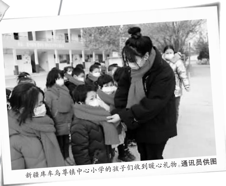
新疆库车乌尊镇中心小学的孩子收到暖心礼物。