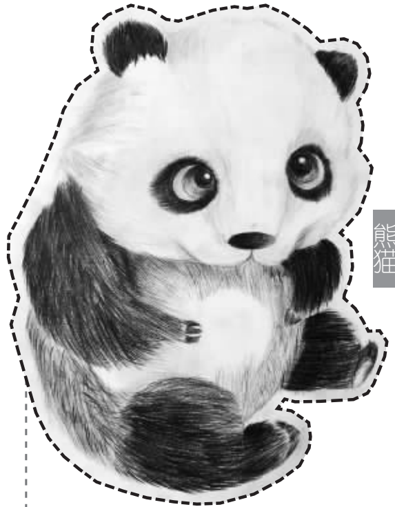
北仑区岷山学校 408班 洪瑾(证号 1006382)