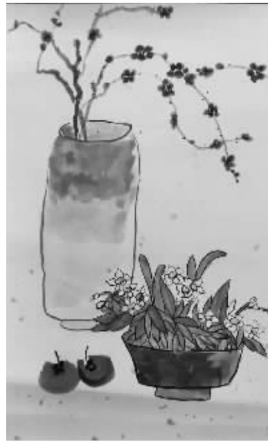
镇海区骆驼中心小学 204班 沈佳涵(证号 1001326) 指导老师 袁娜

顿时,我的心里涌着一股暖流,想到平日里我经常跟妈妈对着干,可是她每天换着花样给我做好吃的,无微不至地照顾我,还要时不时地忍受我的坏脾气。她对我包容、关爱、体贴,我又怎么能这么不懂事呢?想到这里,我在心里默默地对自己说,以后再也不要让妈妈这么操心了。