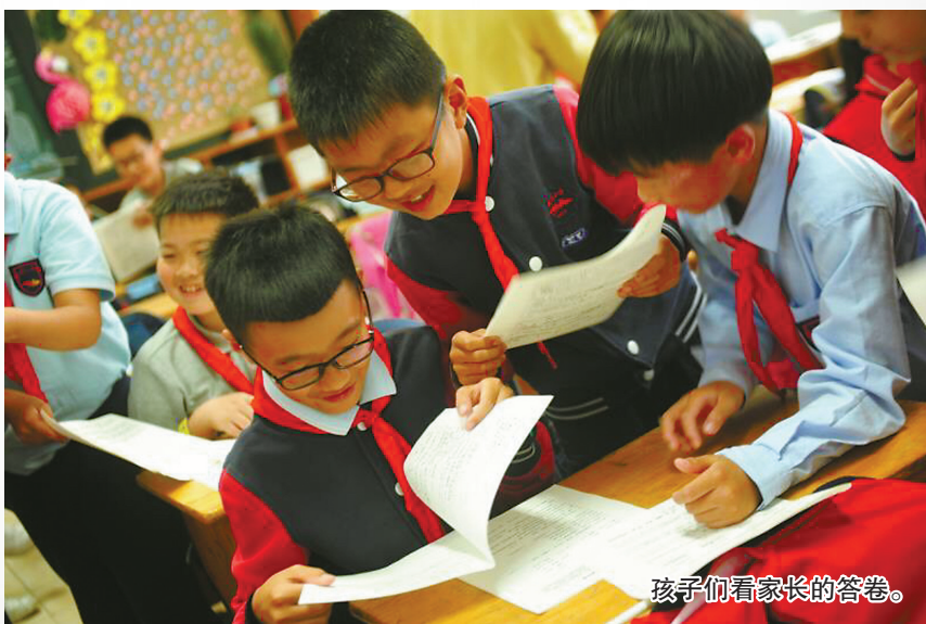
孩子们看家长的答卷。