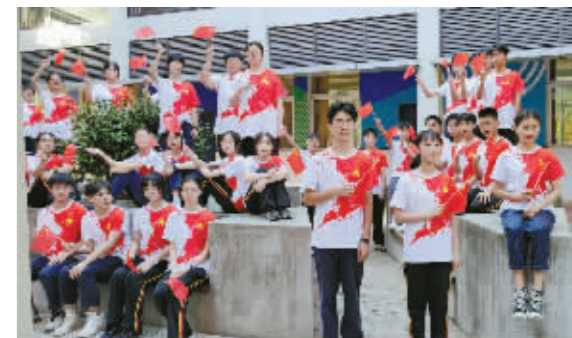
镇海区龙赛中学举行迎国庆活动。