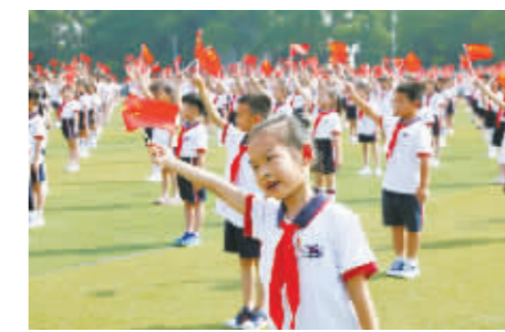
慈溪润德小学的孩子们同唱《我和我的祖国》