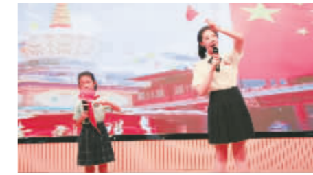
高新区实验学校502中队朗诵《向英雄致敬》,献礼国庆。