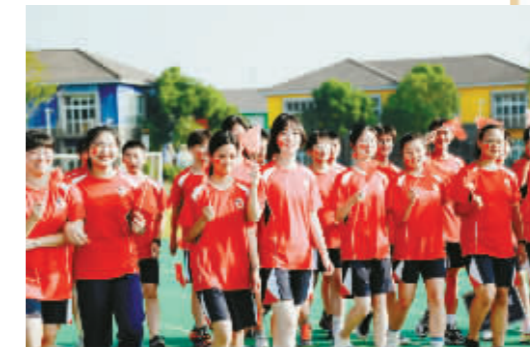
宁波至诚学校学生集体朗诵《请党放心,强国有我》,向祖国致以青春的礼赞。