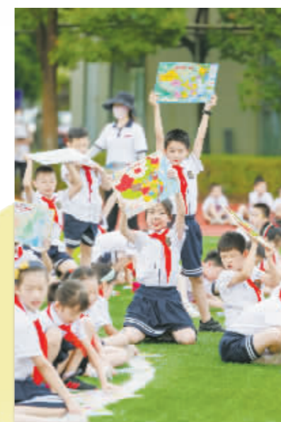
鄞州区东南小学教育集团举行了“爱国励志,强国有我”主题庆祝活动。