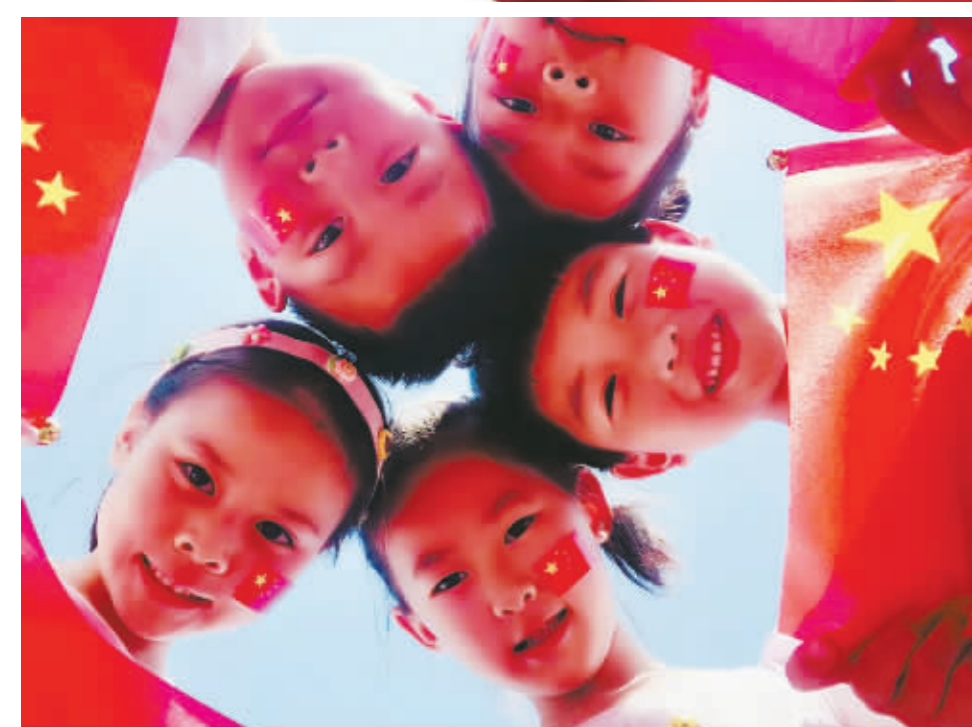
慈溪市横河镇中心幼儿园的孩子们与五星红旗合影,表达着节日的喜悦和对祖国的祝福!

在中华人民共和国成立72周年之际,宁波市各地各校开展了丰富的活动,以不同的方式喜迎国庆,表达自己对祖国母亲深深的祝福。 鄞州区五乡镇贵玉小学开展了以“怀感恩之心,唱祖国赞歌”为主题的系列教育活动。在9月29日上午举行的升旗仪式,一面长18米的巨幅国旗惊艳亮相,震撼的场面点燃了每一位学子炽热的心。 当天上午,宁海县黄坛镇中心幼儿园的360余名师生身着整齐的服装欢聚一堂,用歌声唱出了对祖国的拳拳之心,殷殷之情。 慈溪市实验幼儿园的孩子们,用自己的身影拼出“国庆”字样;慈溪润德小学的绿茵场上歌声嘹亮,一千多名师生高歌《我和我的祖国》;慈溪市文锦书院的孩子们,或剪或贴,或画或捏,用亲手制作的作品向祖国妈妈“比心”。 余姚新城市小学的全体师生,有的手持小国旗,有的脸上贴着国旗,还有的拿着各种爱国的标语牌,在学校和国旗合影,表达对祖国深深的祝福和无尽的热爱! 本报编辑部