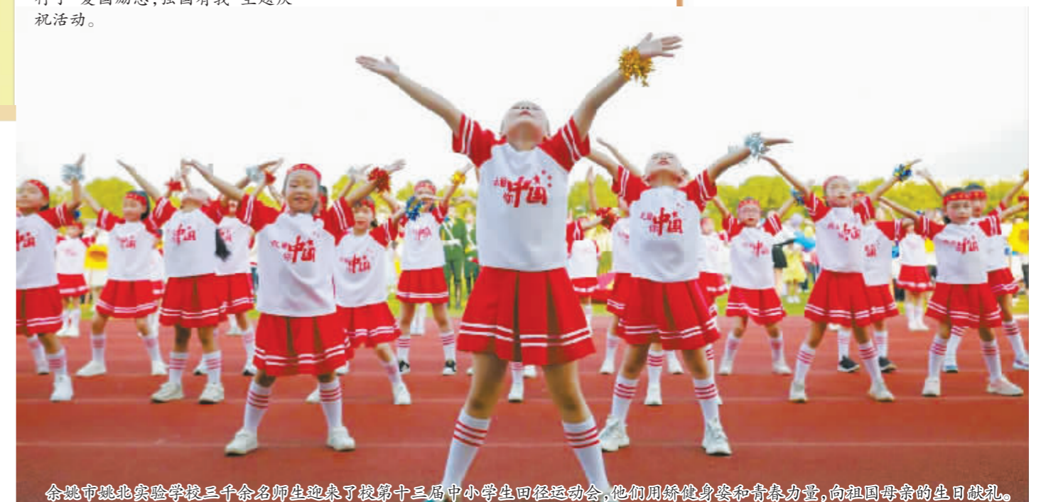
余姚市城北实验学校三千余名师生迎来了第十三届中小學生田径运动会,他们用矫健身姿和青春力量,向祖国母亲的生日敬礼。