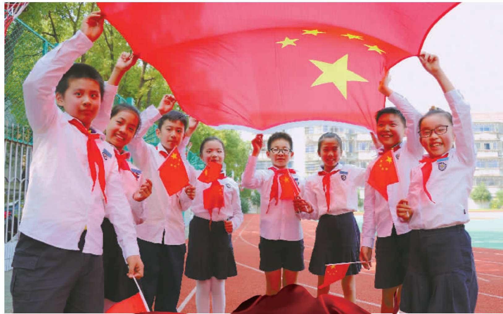
余姚新城市小学的学生和国旗合影, 表达对祖国深深的祝福和无尽的热爱。