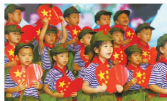
9月29日上午,宁海县黄坛镇中心幼儿园的360余名师生身着整齐的服装欢聚一堂,他们用美妙的旋律来喜迎国庆节,唱出对祖国的拳拳之心,殷殷之情。