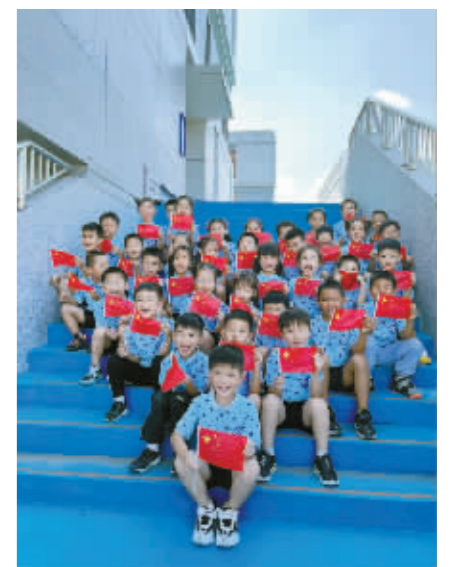
中意宁波生态园实验学校的学生向伟大祖国深情表白。