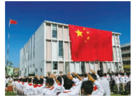
9月29日,鄞州区五乡镇贵玉小学举行升旗仪式,一面长18米的巨幅国旗惊艳亮相,点燃了每一位学子炽热的心。