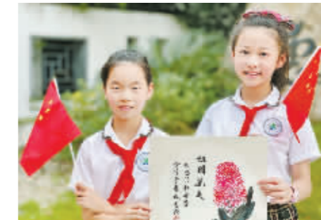
惠风书院的同学们用心临摹齐白石作品——《祖国万岁》,表达爱国之情。