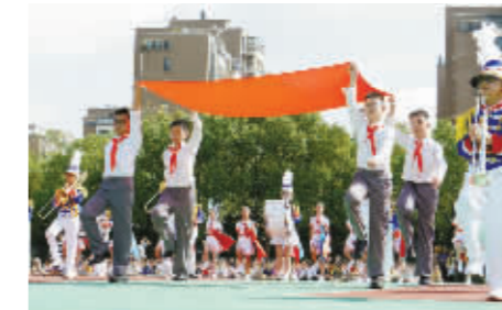
9月30日,惠贞书院小学部鼓乐队的同学们演奏少先队仪式歌曲。