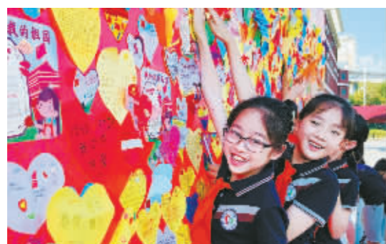
慈吉实验学校小学部的师生把亲手制作的贺卡贴在表白墙上,以表达对祖国深深的祝福和无尽的热爱!