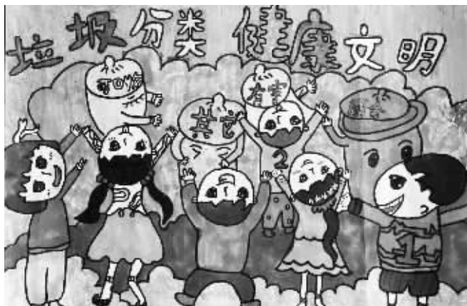
垃圾分类 健康文明 海曙区鄞江镇燕岭学校601班 杨茜(证号1005757)