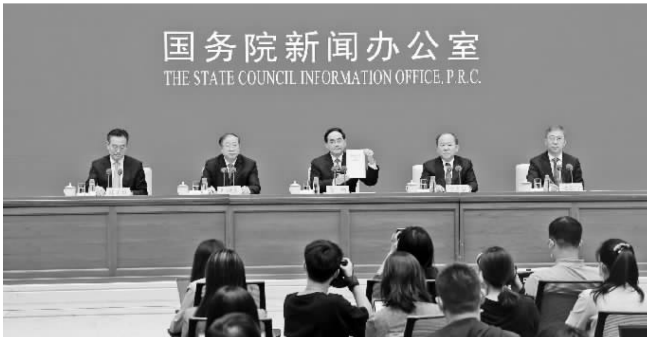
9月28日,国务院新闻办公室发表《中国的全面小康》白皮书。据新华社