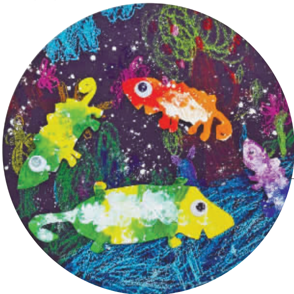
变色龙 海曙外国语学校102班 潘羽墨(证号1002358)

经过这次学骑自行车,我明白了:世上无难事,只怕有心人。任何事情,只要我们坚持下去,就能取得成功。