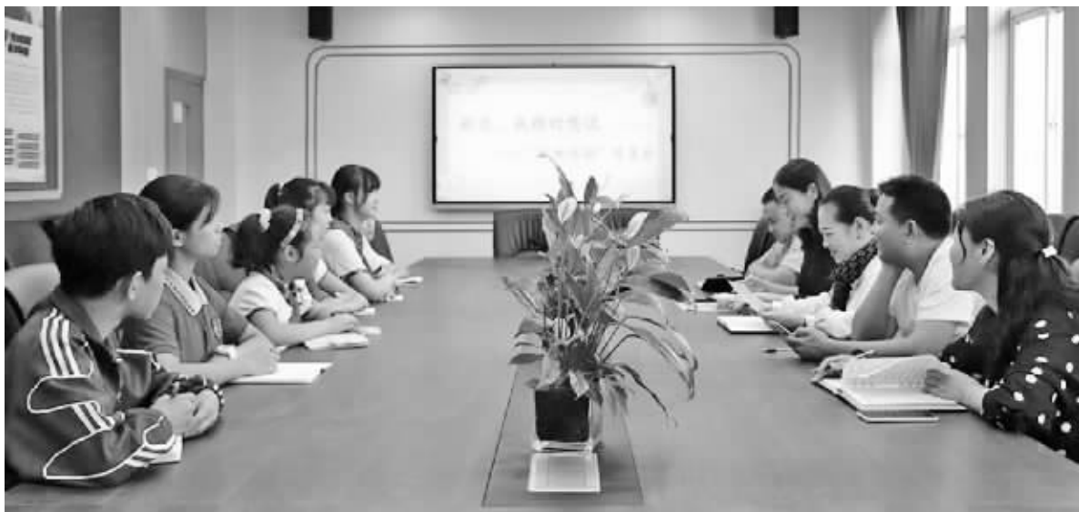
学生们是“评论员”,老师们成“办事员”,这场特殊师生见面会让学校更和谐。