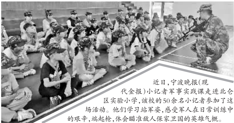
近日,宁波晚报(现代金报)小记者军事实践课走进北仑区实验小学,该校的50余名小记者参加了这场活动。他们学习站军姿,感受军人在日常训练中的艰辛,端起枪,体会瞄准敌人保家卫国的英雄气概。

★国庆节期间,我看了电影《长津湖》,对中国军人的勇敢非常钦佩,期待有机会能更多地了解我们的军人叔叔。幸运的事终于来了!一天下午,宁波晚报(现代金报)小记者军事实践课来到了我们学校。