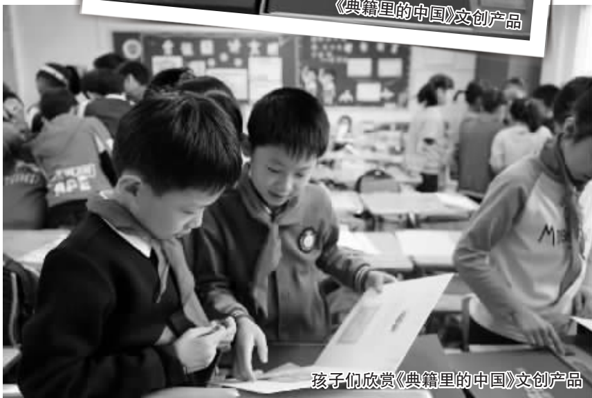
孩子们欣赏《典籍里的中国》文创产品