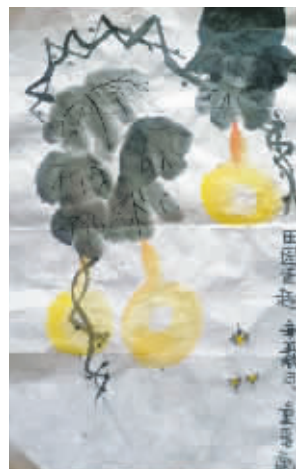
鄞州区德培小学403班 童一诺(证号1006760) 指导老师 厉莎莎