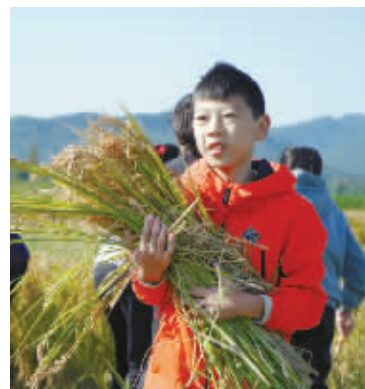
孩子炫耀他的“战利品”。

的重要举措,也是推进教育改革、建设高品质窗口学校的关键环节。学校秉持“一次学农,影响一生”的理念,不定期组织学生参加各种劳作,使城区生活的孩子也能获得真实的农耕体验,从而养成良好的劳动习惯,形成正确的劳动观。