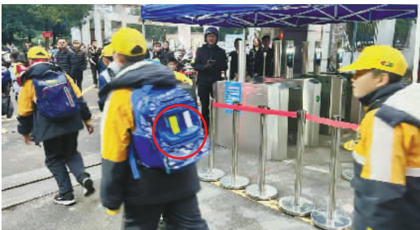
图中画圈处为反光条