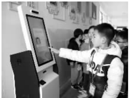
学生来到教室旁边的智能终端,刷卡累计积分。