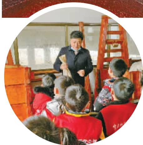
认真听酱油的酿造过程。