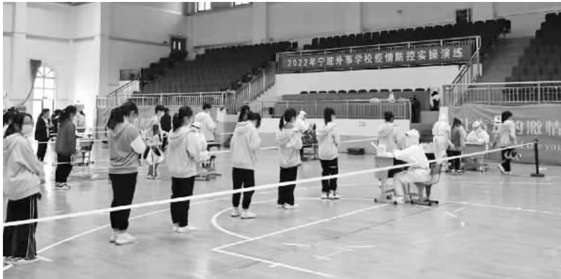
外事学校的同学们在进行核酸检测。