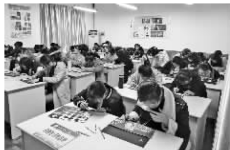
学生在美术课堂上练习刮版画。