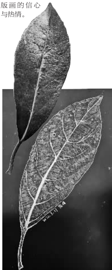
学生创作的刮版画。

经过十多年的发展沉淀,奉化高级中学学生创作的刮版画作品在全国、省市级比赛累计获奖23人次,参与国际交流32人次,有35人次的学生作品在奉化文化馆、奉化博物馆等场馆展出。同时师生刮版画作品被带出国门、走向世界,不断提升师生学习刮版画的信心与热情。