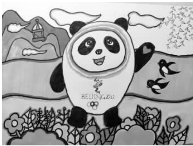
宁波大学附属学校小学部206班 叶偲芮(证号2216295) 指导老师 陈科