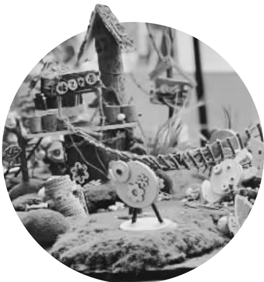
展览上孩子们的作品。

“没想到幼儿园的孩子们能制作出如此精美的作品。刚才幼儿园负责人介绍都是孩子们自己做的,为孩子们点赞!”“原来一根小树枝、一片小叶子可以通过这么多的方式保留下来,美真的无处不在!”许多参观者停下脚步,拍起了照片。