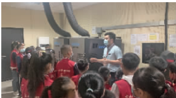
小记者们在放映室寻找如何放电影的答案。