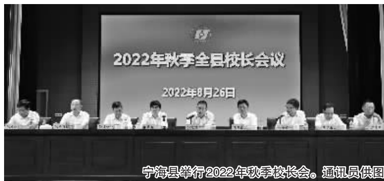
宁海县举行2022年秋季校长会。