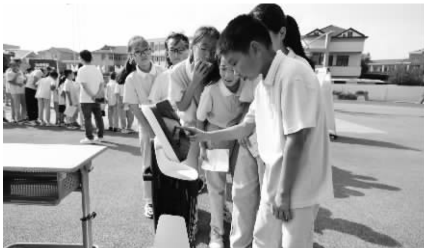
孩子们与机器人对话。