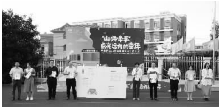
课程包首发仪式现场。

接着，17个小朋友开始写信给远方的父母。他们把自己的思念，想跟父母说的悄悄话，都封在了这封信里。小小的教室里，充满了温情和爱意。