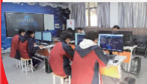
余姚市第四职业技术学校学生在 学习计算机知识。

“立法能够厘清责任,现实中出现的不少问题单靠教育部门是解决不了的,往往会出现政府统筹力度不足和部门职责不清的问题。而通过立法的形式,可以打破行政边界,整合各部门之间的资源,为教育更好发展奠定良好的法制环境!”宁波市人大常委会教科文卫工委副主任张建国说。