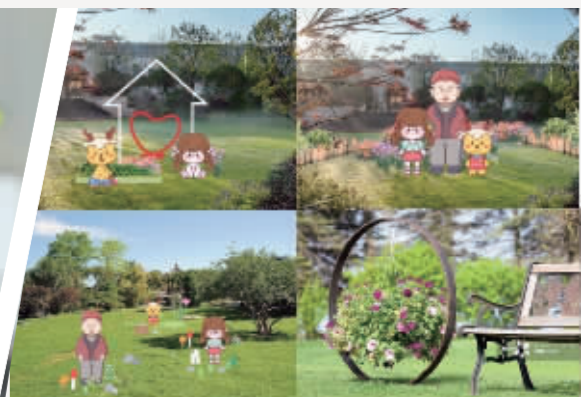
浙江万里学院为鲍家套小区设计的IP形象。

在甬各高校和地方深度合作,积极服务乡村振兴战略。比如,浙江万里学院与鄞州区人民政府合作共建了“鄞州—万里乡村振兴研究院”,为鄞州区在建设区域农村农业现代化先行区、打造乡村振兴的“鄞州样板”提供科技助力。