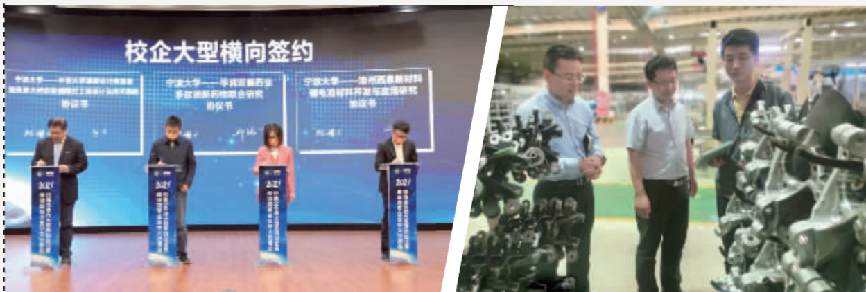
宁波大学和中铁大桥勘测设计院集团签约。

科学研究和社会服务,也是高校的重要职能。十年来,在甬高校肩负服务支撑国家和省重大发展战略的时代重任,把握产教融合的发展脉搏,服务区域提质,成为推动产业升级过程中的重要“军师”。与经济社会、产业结构、城市生态同频共振,助推宁波建设世界一流强港、推动现代产业体系,为宁波高质量发展建设共同富裕示范区贡献在甬高校力量。