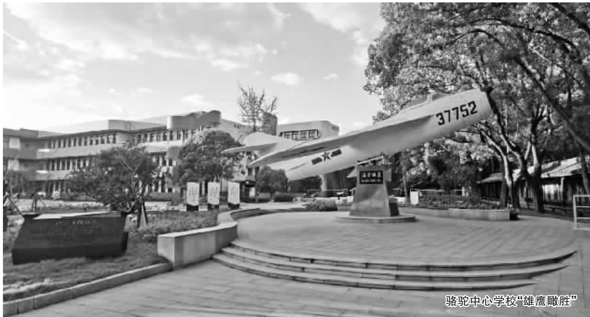
骆驼中心学校“雄鹰瞰胜”