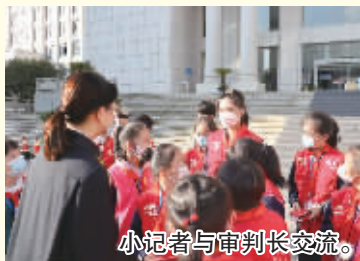
小记者与审判长交流。