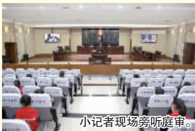
小记者现场旁听庭审。