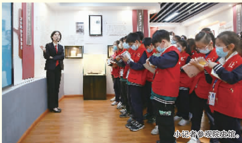
小记者参观院史馆。