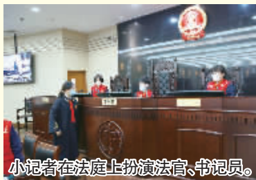
小记者在法庭上扮演法官、书记员。