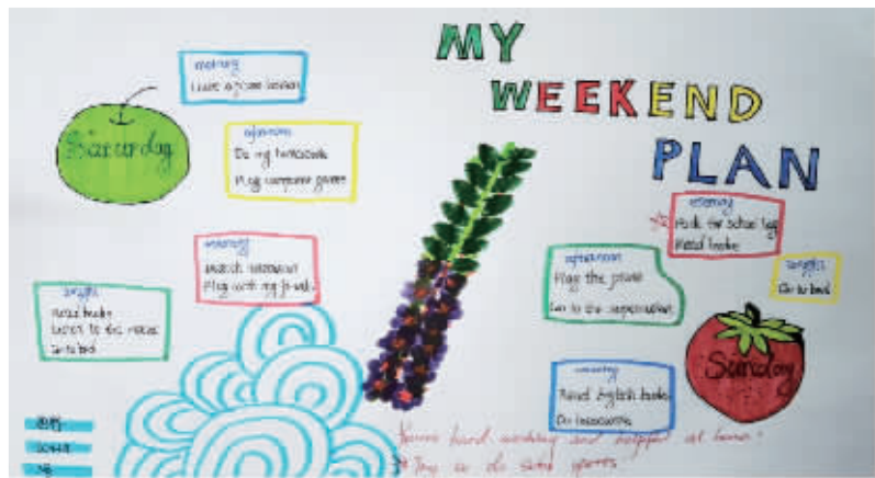
带“温度”的作业评价图。

学生在运用英语写的过程中难免出现单词、语法错误,教师在改作时也常常只关注这些错误点,忽视了学生所要表达内容的真实性、思维性。在“空白”预学单是一项自由度较高的作业,在作业评价中,笔者对作业的对错采取了比较宽容的态度,并结合单元话题,对内容给出建议。比如在批改学生作业(下图)时,发现她的周末计划学习和娱乐结合,而且还有整理书包这一项,就是缺少一些运动,于是先肯定她的用功和能干,再提出做运动的建议,在之后的写作中,她的周末计划更加合理且丰富。