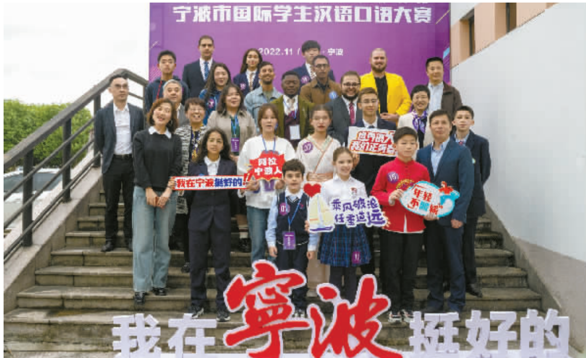
选手与评委合影。