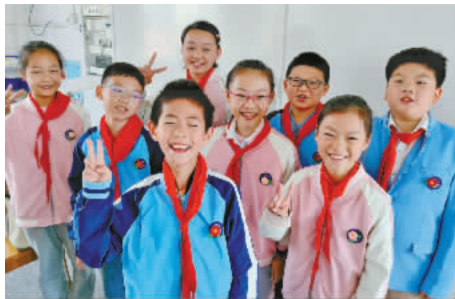
戴上同学送的胸花后,大家脸上笑开了花。