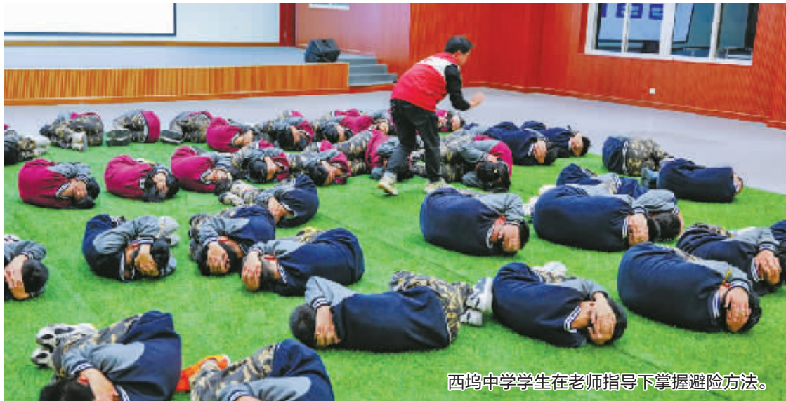
西坞中学学生在老师指导下掌握避险方法。

本报讯(现代金报 | 甬上教育 记者 王冬晓 通讯员 蒋成)“双手十指交叉紧扣,用手肘夹紧头部……”近日,在宁波市奉化区滕头学生社会实践基地的室内篮球场,四十余名来自西坞中学的学生们正在专业老师的指导下,进行预防踩踏应急演练。