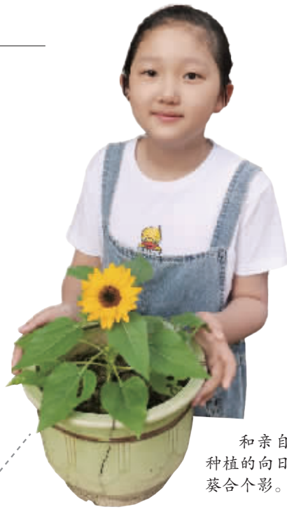
和亲自种植的向日葵合影。