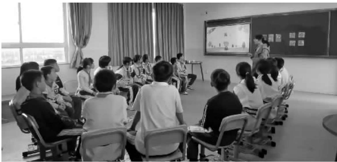
学生们踊跃表达观点。