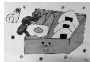
伍诗倚画的美食。