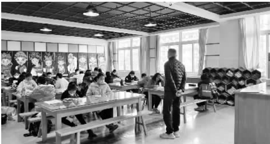
慈溪市城区中心小学,线下托管进行中。

记者了解到,这个寒假,部分初中推出了线上托管服务,比如鄞州区的鄞州实验中学、曙光中学、春晓中学等都有类似服务。