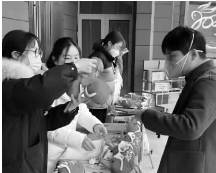
老师们为孩子准备“福袋”。

本报讯(现代金报 | 甬上教育记者 徐徐 通讯员 李彦君)“这是我们全家收到的最温暖的‘快递’,遇见的最特别的‘快递员’……”