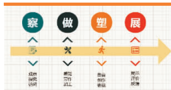
图3 “做中习”生活考察模式图