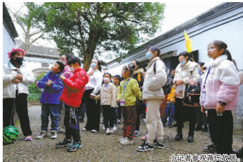
小记者参观蒋氏故居。