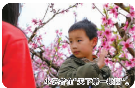
小记者在“天下第一桃园”。

桃红柳绿菜花黄，眼下正是赏花踏青的大好季节，3月18日，80多位宁波晚报（现代金报）小记者和家长一起，应宁波市住建局（市风貌办、市美镇办）的邀请，分三路前往打卡共富“宁波之春”城乡风貌专线。这三条专线分别是：慈溪南部沿山风情共富线、奉化明山剡水共富线、象山扬帆亚运风情共富线。