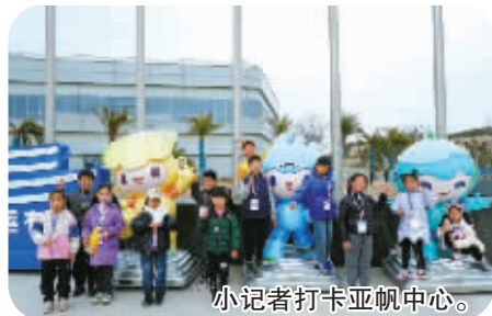
小记者打卡亚帆中心。