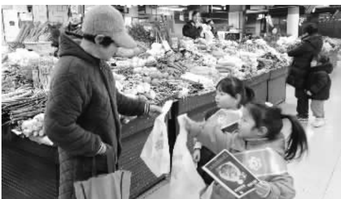
孩子们在菜场宣传“减塑限塑”。

塑料袋属于什么垃圾?装着食物的塑料袋如何正确投放?你平时减少使用塑料袋的方法是什么?你知道一个普通的塑料袋在泥土中需要几年才能分解吗?孩子们提出的问题,有些成年人也拿不准答案。孩子们会认真解释:塑料袋是可以回收的,但是回收后很难处理……童