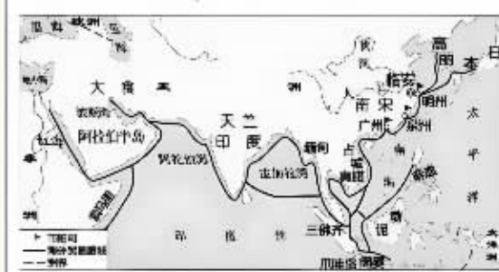
图1 宋代海外贸易图 临安·今杭州 明州·今宁波